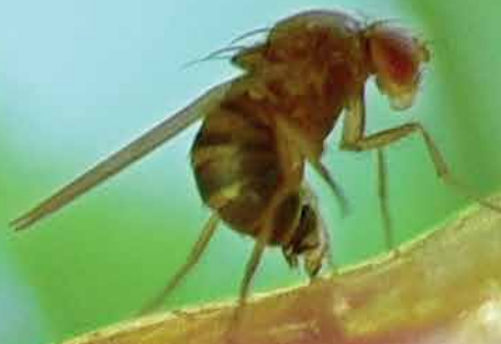
Drosophila suzukii